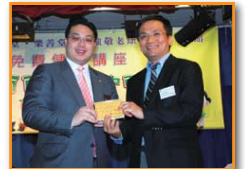
■ 醫務主任委員韓世灝副主席致送紀念品予主講嘉賓—衛生防護中心感染控制主任黃天祐醫生。