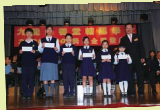
樂善堂各屬校聯合舉辦獎學金頒發典禮，各總理頒發獎學金予表現優異的學生。