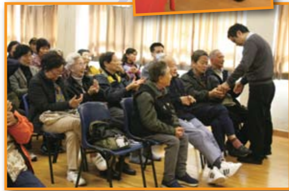
■ 樂善堂註冊中醫師為長者學苑學員介紹常見的痛症穴位。