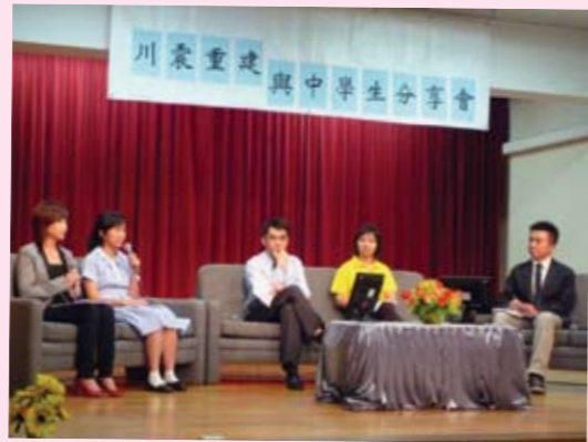
梁鈺琚書院參與有線電視新聞台的直播節目「川震重建-與中學生分享會」，學校派出學生主持及300多名學生參與，讓學生分享對四川震後重建的感受。