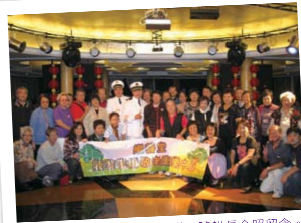
■ 各參加者與世紀鑽石號船長合照留念。