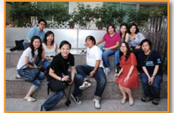
■ 校友們於母校留影。

更難得的是，為了感謝母校的悉心培育，自2007年開始，不斷有校友主動捐出不同類別的獎學金，把感恩之情化為培育學弟妹的薪火，同時對學弟學妹在各方面的表現作出肯定。當中包括鼓勵永不放棄精神的「勤誠獎學金」、照顧在學習差異上需要的「仁愛82基金」、強調透過協作學習、互相勉勵扶持、共同改進的「摯友獎學金」、資助家境清貧的參加交流活動、豐富知識，廣闊視野的「八爪魚獎學金」、讚賞勤學表現的「勤學獎學金」及獎勵高級程度生物科表現優異的「生物科獎學金」等。立己立人，薪火相傳，這些獎學金的設立，再一次見證了「余中」校友不忘母校的珍貴情誼！