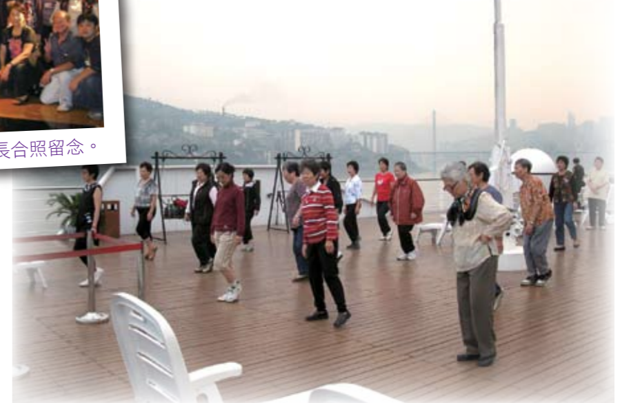
■ 大家在舢板上一起跳排排舞，舒展筋骨。

陳黎掌嬌敬老康樂中心舉辦三峽遊，各參加者可以乘坐世紀鑽石號，欣賞長江三峽的雄偉景色。期間大家更一起於舢板上一起跳排排舞，健康又快樂。