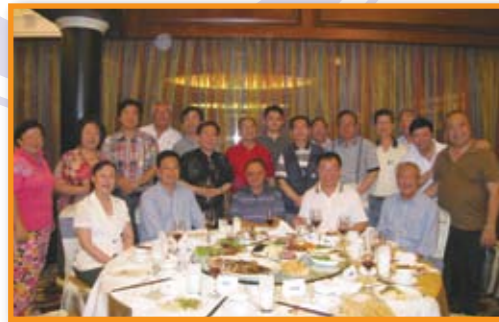
■ 本堂總理設宴答謝有關部門各領導，席間氣氛熱烈。