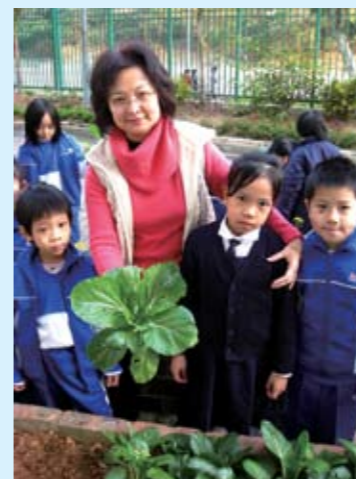
劉德學校積極推廣綠化校園計劃，設立劉德校園植物徑，種植有機蔬果、盆栽等，並由學生出任小導遊，帶領同學參觀，讓同學學懂觀察及愛護大自然。