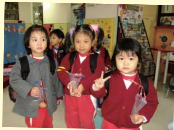
顧李覺鮮幼稚園以「生命教育」為主題，透過舉辦不同的學習活動、講座及工作坊等，讓兒童及家長學會認識自己，保護自己，尊重別人。其中的護「蛋」行動，就讓參與的同學學會保護生命。