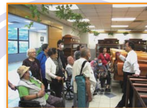
認識中西式及環保棺木。