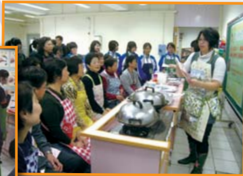
■ 屬校家政科老師指導長者學苑學員及學生共同製作钵仔糕。