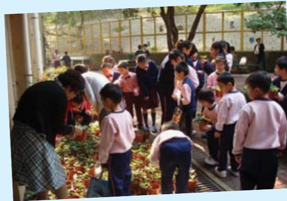
為宣揚樂善關懷的精神，梁黃蕙芳紀念學校於校園舉行年花義賣，將籌得款項全數捐作公益金及宣明會援助海地災民。