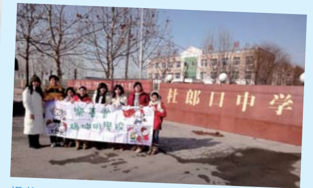
楊仲明學校獲中文大學邀請，參加「濟南五天學校交流團」，除欣賞大明湖的自然美景和參觀多家具教學特色的學校外，更進行教學及課堂討論，加強同學與國內學生的交流，為京滬粵港遠程教學計劃作好準備。