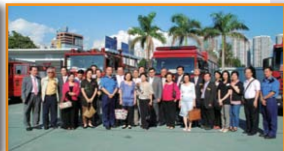
■ 本堂總理在消防處合照留念。