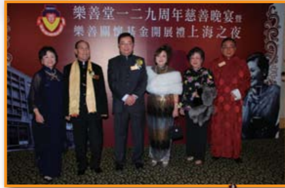
■ 眾人皆穿上中式禮服出席晚宴，以響應當晚主題－「上海之夜」。