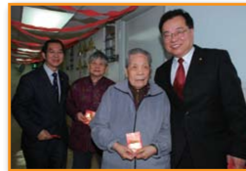
■ 齊主席與江炎輝副主席與長者們合照。