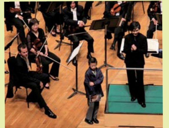
香港小交響樂團音樂總監葉詠詩女士與本堂合作籌辦交響樂音樂會予本堂轄屬學校，培養他們對音樂之認識和興趣。