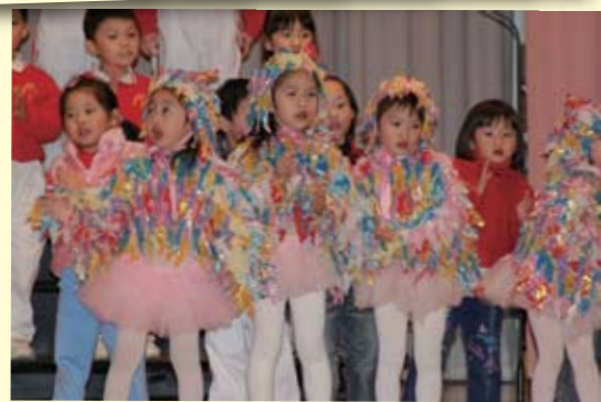
張葉茂清幼稚園之學生參與屬校小學的歌唱比賽獲得獎項。