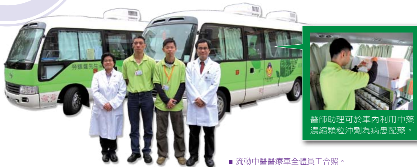
■ 流動中醫醫療車全體員工合照。

近年，本堂亦積極籌辦流動中醫醫療車，讓更多有需要的人士，可以接受本堂具質素的中醫藥治療。在政府有關部門的大力支持及善心人士捐贈贊助下，本堂兩部流動中醫醫療車於本年2月1日正式投入服務，分別停泊於屯門診所停車場及大埔王少清診所停車場內，為廣大市民提供非牟利的中醫醫療服務。稍後，本堂亦計劃安排醫療車停泊於其他地點，讓更多人受惠。