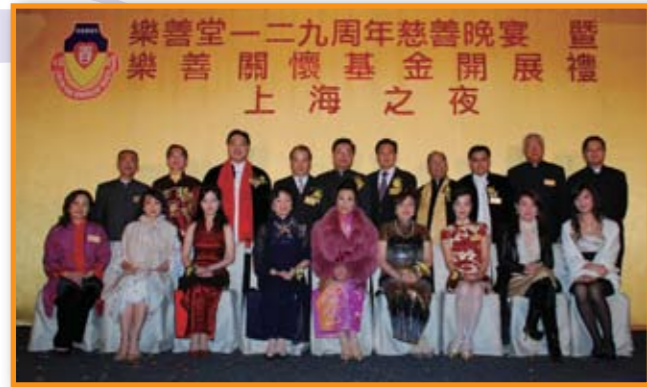
■ 一眾主禮與「樂善關懷基金」贊助人於台上合照留念。

在樂善堂129周年慈善晚宴中，本堂宣佈正式開展新服務－「樂善關懷基金」，並邀請勞工及福利局張建宗局長親臨主禮，中聯辦九龍工作部林武部長擔任監禮人，汪明荃博士義務擔任「樂善關懷大使」。