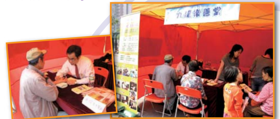
■ 本堂註冊中醫師於「救護服務獻關懷之葵青安全健康活力添姿采」活動上，為坊眾進行義診服務。