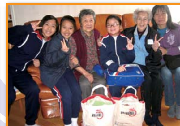
■ 「樂善之友」們與受訪長者合照留念。