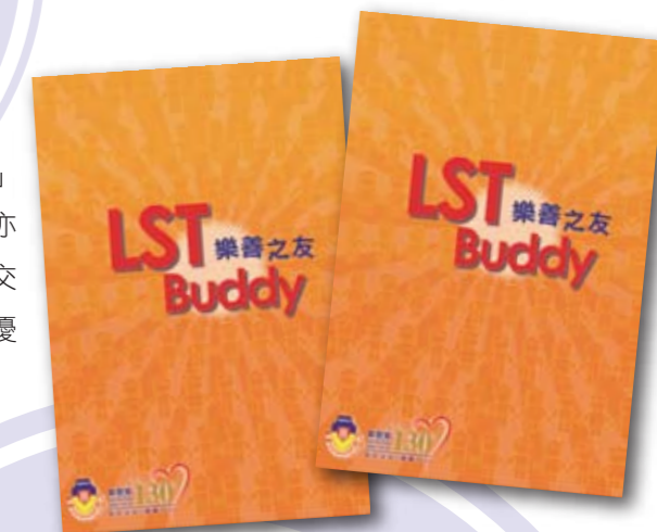
■ 「樂善之友」現已接受報名。

有興趣登記成為「樂善之友」的人士可瀏覽本堂網站 ( http://www.loksintong.org )。