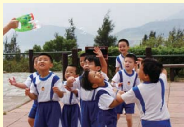
樂善堂幼稚園的小朋友到大澳門進行戶外學習活動，讓小朋友透過戶外學習，從實際的經歷和經驗中建構新的知識。