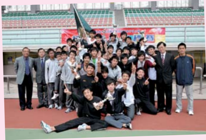
梁植偉中學田徑校隊於「葵青區校際田徑比賽」中表現出色，勇奪男子全場總冠軍及多項團體冠亞獎盃。