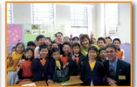
Happy Learning Healthy Growing