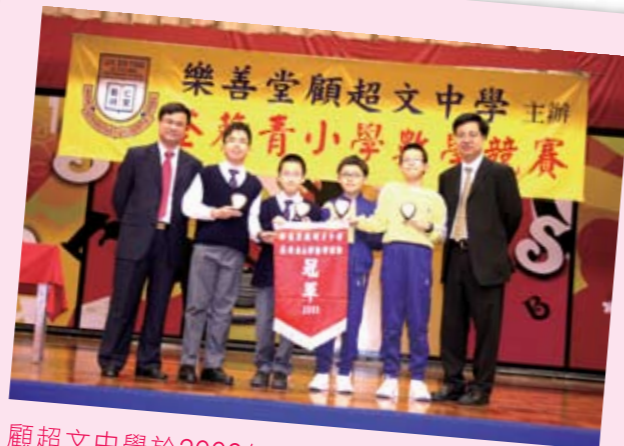
顧超文中學於2009年12月12日舉辦葵青小學數學競賽，吸引了36間小學參與，並獲香港中文大學保險、財務與精算學系陳偉森教授擔任主禮及頒獎嘉賓。