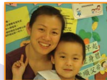
寶寶臉上快樂的笑容，是母親無私付出的成果。

樂善堂鄧德濂幼稚園推行親子閱讀計劃恆之有年，亦得到校內家長的認同，此計劃確能培養兒童閱讀習慣和興趣，增加幼兒的課外知識及提昇語文能力，亦可加強親子溝通。很多父母都以為講故事很難，並認為自己不懂講故事，只有專業的老師才能把故事講得動聽，真的嗎？本園為配合學校的親子閱讀計劃，舉辦了「家長到校講故事」活動。以下就是本園一位家長為大家分享自己的感受，相信大家閱後定必為這位家長及小朋友感到興奮及喜悅。