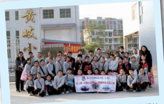
梁鈺琚學校(分校)五年級的同學前往佛山探訪姊妹學校黃岐小學，並與當地學生交流。