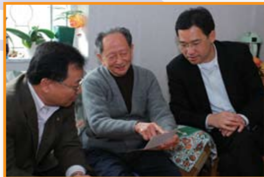
■ 齊光華主席、王樂得總理與「老友記」相談甚歡。