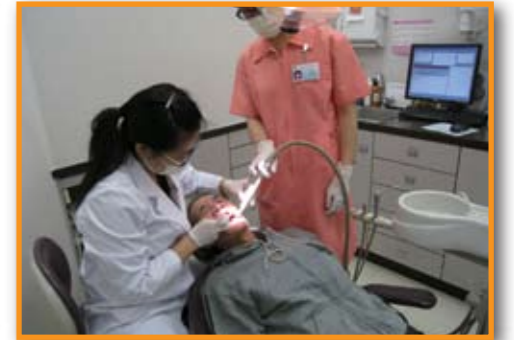
■ 牙科診所醫生為病人悉心治療。

時至今日，本堂分別在九龍城、旺角及大埔設有牙科診所，提供洗牙、脫牙、補牙、齦管治療和假牙等服務。由於需求日趨殷切，決定增設牙科診所，並選址於牛頭角轄屬樂善大廈地下商舖，服務東九龍區居民。診所現正進行裝修工程，預計於本年中上旬投入服務，以紓緩普羅大眾對優質而廉宜牙科治療的需要。