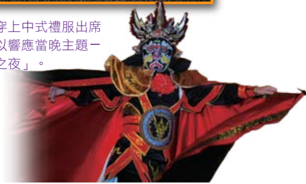
■ 變面大師韋師傅技藝超群，贏得台下如雷掌聲。