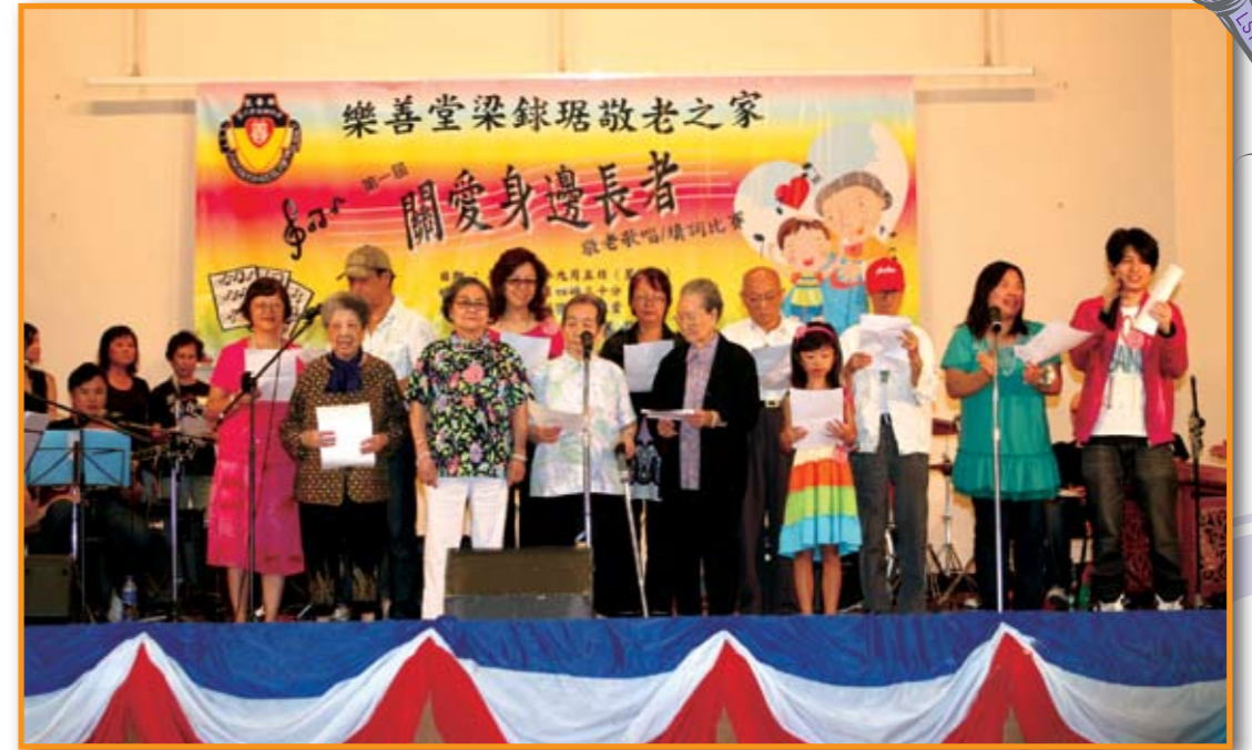
■ 第一屆歌唱及填詞比賽尾聲時，參加者、院友及職員一起唱院歌。

梁鈺琚敬老之家為喚起社會人士關愛身邊長者，舉辦第一屆關愛身邊長者敬老歌唱比賽，以「歌」獻上對長者的關懷和肯定。比賽得到各方好友踴躍參與，參賽者由8歲至80多歲，齊齊以歌曲及新詞去表達對長者的敬愛之心，共建「安老護耆」的社區。