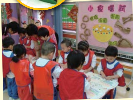
文吳泳沂幼稚園的同學一起製作湯丸、糖環、蛋散和角仔，藉此認識農曆新年的食品及感受新年氣氛。小朋友雖然年紀小，但仍用心地製作出不同的新年食品。