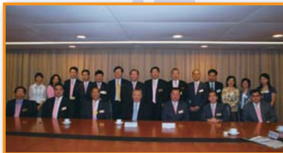
■ 本堂總理與教育局孫明揚局長合照留念。