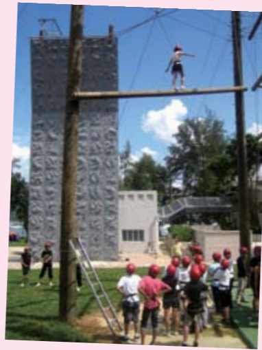
楊葛小琳中學舉辦的「陽光計劃學生訓練營」，由老師推薦學生組成「陽光學生」團隊，透過各種活動深化學生的品格、堅毅、承擔、勇敢及待人處事等個人素質。