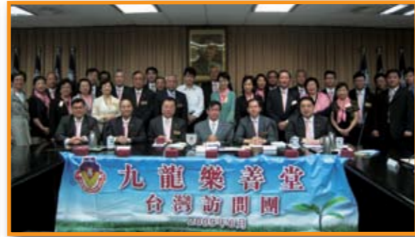
■ 訪問團與接待官員合照留念。