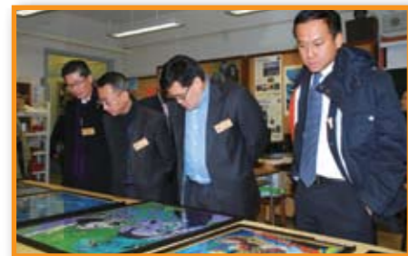
■ 各總理駐足欣賞同學作品。

為加強了解各單位之日常運作，完善本堂各項服務質素，常務總理會分別巡視轄下的醫療、教育及社會服務單位。