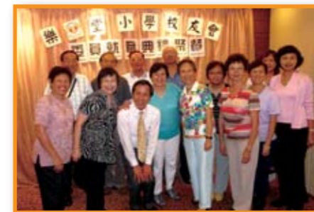
樂善堂小學校友會委員就職典禮聚餐。