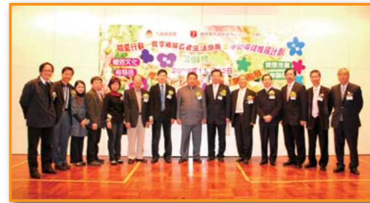
■ 齊光華主席暨總理們，與眾主禮嘉賓，齊齊為「關愛行動—齊享鄉郊長者生活樂趣及中醫保健推展計劃」主持啟動禮儀式。