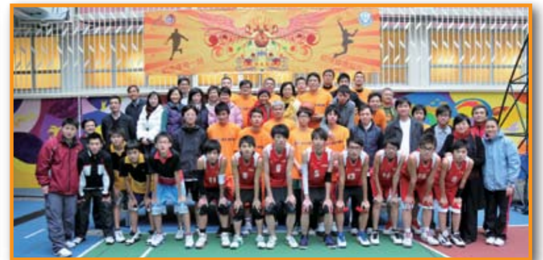
■ 樂善堂余近卿中學籃球隊。