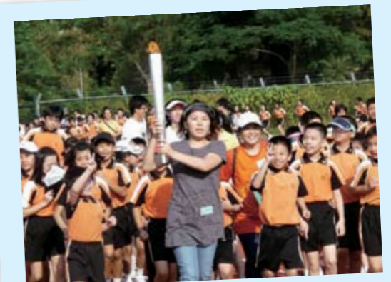
樂善堂小學鼓勵同學愛運動，特別在校運會上加插火炬接力。擎火炬，舉光明，領學子，奮進前，賀國慶，迎東亞，愛國家，愛香港。