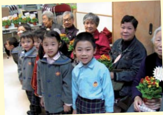
梁泳釗幼稚園舉辦愛心行動，小朋友向公公婆婆送上荷包花，祝福他們身體健壯。