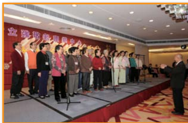
尹立強中心的會員在二十周年晚宴上表演花棒操及大合唱。