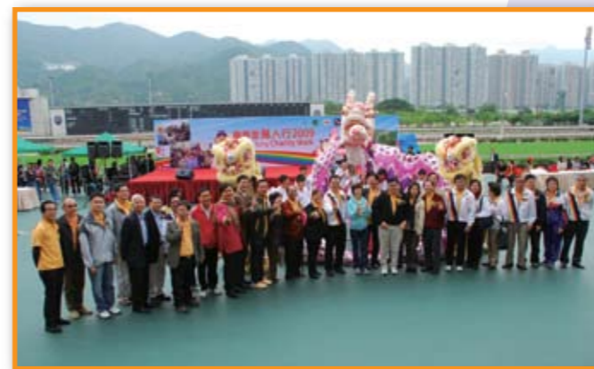
■ 一眾總理於醒獅前合照留念。

為籌募本堂醫療、教育及社會服務經費，及促進各轄屬單位之團結精神，本堂舉辦「樂善堂萬人行2009」。各參加者由沙田馬場出發，沿城門河步行至沙田公園，在做善事之餘更可享受郊遊之樂。